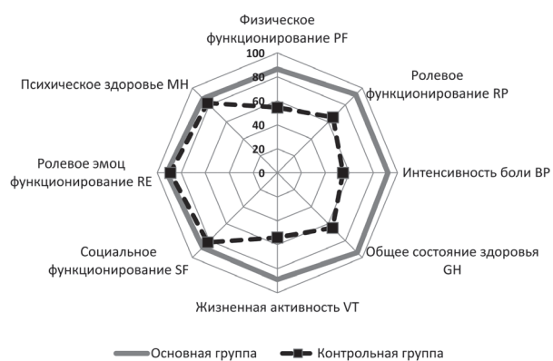
Рис. 3. Диаграмма оценки качества жизни пациентов основной и контрольной групп по опроснику SF-36 к моменту выписки из стационара

Нами выявлено, что у пациентов основной группы сроки послеоперационной реабилитации пациентов значительно короче ( 11,1 \pm 1,7 и 19,2 \pm 3,4 дней в контрольной группе, p < 0,05 ). Это связано, в первую очередь, с минимальной выраженностью болевого синдрома у пациентов основной группы и более высоким качеством их жизни. Оценка качества жизни пациентов по опроснику SF-36 обеих групп к моменту выписки представлена на рисунке 3.